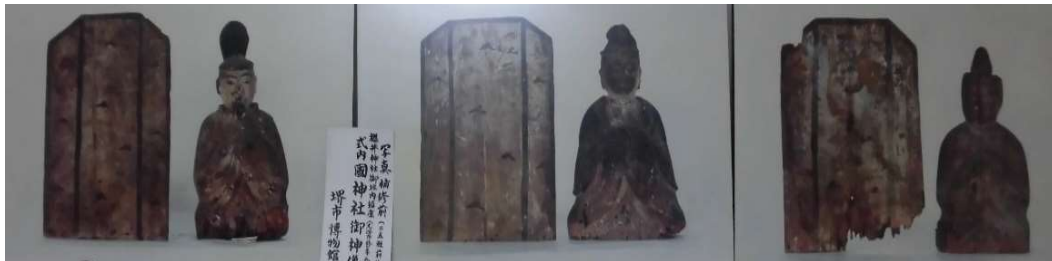
男神像 22,2 cm

御神体として神殿の奥深く祀られている男神像、菩薩形像、明王形像の三体の神像は檜の一材から彫りだされ、かつては彩色が施されていた痕跡が有ります。