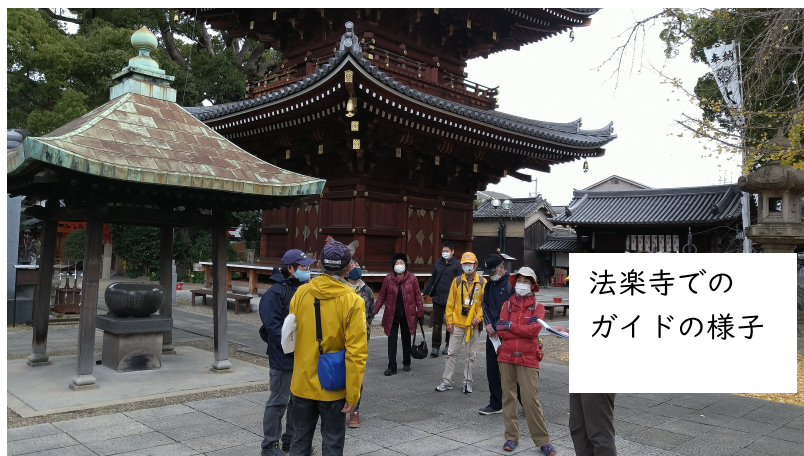
法楽寺での ガイドの様子

堺観光ボランティア協会も3月にイベントを企画していますが、新型コロナウイルス感染症の状況により催行が懸念されますが、実施する場合は今回のウォークを参考にして慎重に準備したいと考えています。