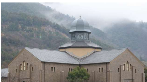
キリシタン聖堂を模した安土城考古博物館