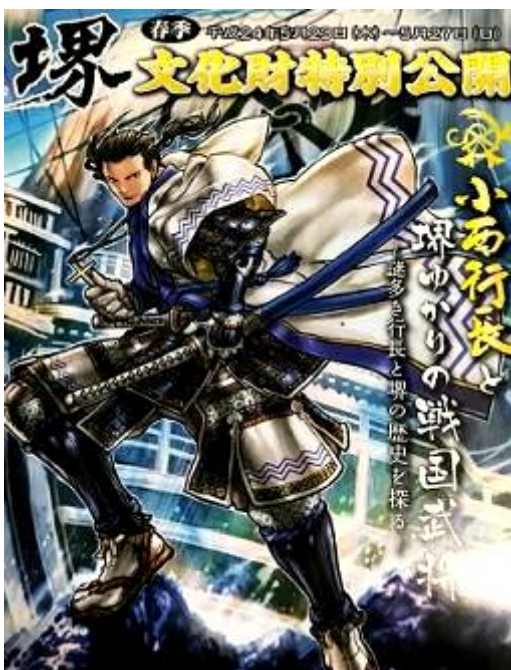
平成24年・春季文化財特別公開パンフレット 小西行長と堺ゆかりの戦国武将