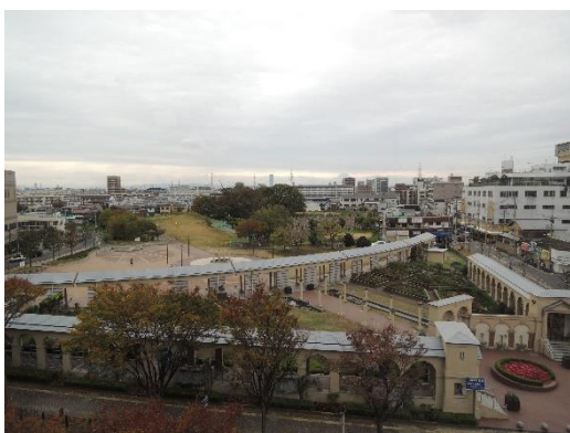
ベルマージュから東雲公園

また堺区に東雲西町、北区に東雲東町があります。もとは堺市向井町字北庄の一部。大正 11 年(1922)東雲町となり、昭和 25 年(1950)に東西に分かれました。阪和線を横断する地下通路と東雲公園があります。