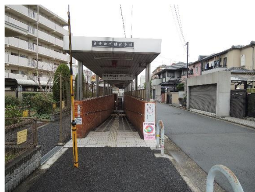
東雲地下横断歩道