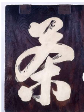
戦災で焼け残った 屋号の看板

なぜ、お茶がおもてなしに現代でもなお大切にされ、最上の飲み物とされているかご理解いた