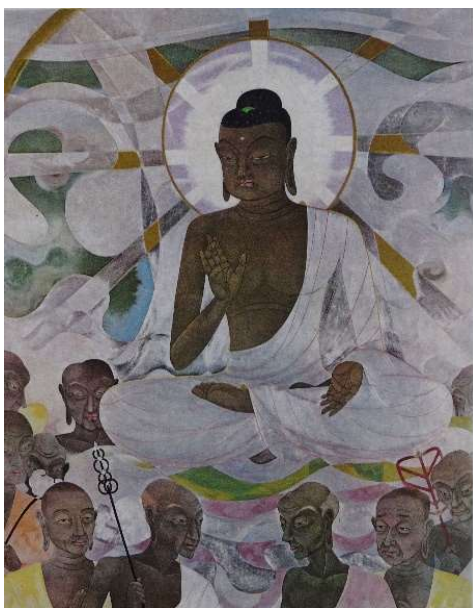
極楽門釈迦十大弟子図

「高橋君原瘞（ゲンエイ）地之碑」： 亡くなった場所の碑 「閻門（コウモン）殉難」： 一家全てが犠牲