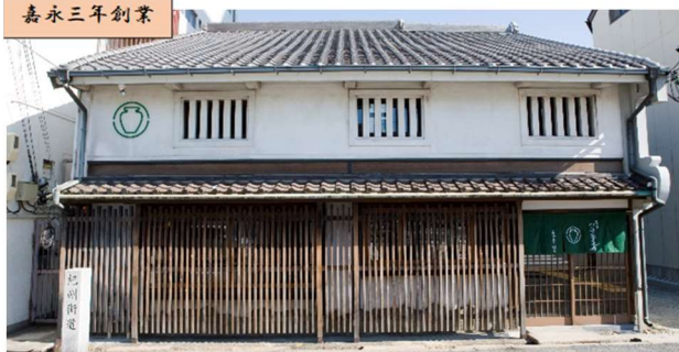
茶寮 つば市製茶本舗 堺本館