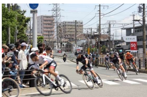
スピード感あふれるコーナリング