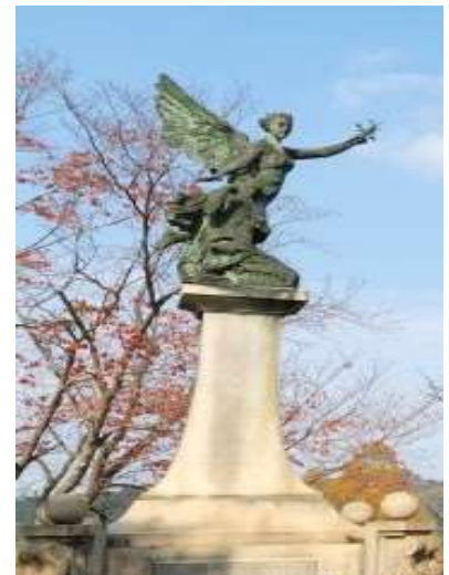
神戸市立外国人墓地慰霊塔

事件は、土佐藩士による発砲、フランス水兵11名の死亡、フランス政府の怒り・五カ条の要求、日本政府は各国に天皇政府承認を要請するための京都御所での天皇の公使謁見を急いでいる折、大坂と堺を鹿兒島が受けたような砲弾、焼夷弾で艦砲射撃されては堪らないという判断から要求を受諾、事件からわずか一週間2月23日妙國寺で土佐藩士20名の切腹を決定、11名切腹の後、フランスの申出により切腹中止、9名はその後四万十川西へ流罪、9月明治改元とともに発せられた恩赦令により赦免と目まぐるしく推移します。