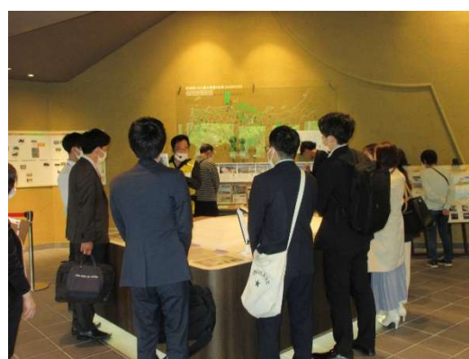
百舌鳥古墳群ビジターセンター