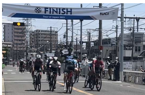
フィニッシュの瞬間