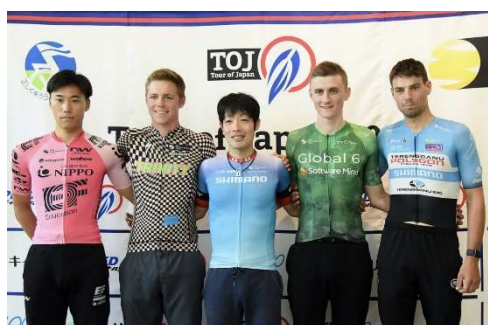
利晶の杜での前日記者会見