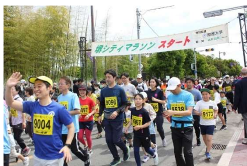
ファミリーの部スタート