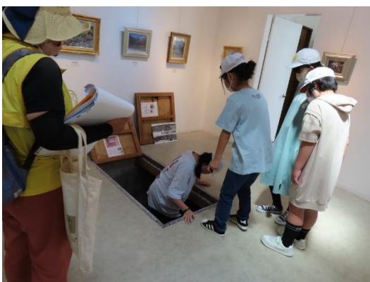
「ギャラリーいろはに」の防空壕で

また、防空壕では実際に入ってみるという体験もありました。感想を聞いてみると、「怖かった」「暗かった」「こんなところ入りたくない」と口々に答えてくれましたが、入らざるを得ない状況も理解してくれたみたいです。