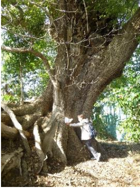
樹齢 700 年のクスノキ

×14m 程度の隅丸の形をした頂上に着きます。北西隅には近世の瓦質の祠があります。この祠は「北村古壘之図」に描かれた「宇賀御魂明神」の位置に合致します。木々の間からの眺めは素晴らしく、空気が澄んでいると淡路島まで良く見え、建物が少なかった頃は大阪湾の海の輝きも見る事ができたようです。かつては四方八方を見渡せ、近くを通る西高野街道や河内・和泉・摂津、大阪湾の様子も伺い知ることのできる絶好の場所に北村古壘が在りました。本丸跡から堀に向かいます。土堀が見えてきました。近世以降に作られた瓦葺の土堀で、土堀には須恵器の破片が混じっているようで、大