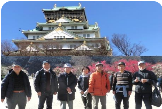
大阪城公園内の梅林にて

仁徳天皇陵古墳の約 2.3 倍の広さを持つ大阪城公園内を同期 7 名で巡りました。約 1 万 4 千歩の行程でした。最初は午前 10 時 20 分から 90 分間の「戦跡めぐり」です。「戦跡めぐり」は、大阪城公園内にある、旧陸軍の建物遺跡や終戦前日の大空襲によるお城への攻撃跡を巡るもので、大阪観光ボランティアガイド協会へ依頼した無料のガイドです。石垣には機銃掃射の跡や 1 トン爆弾による天守閣の石垣のずれが現在も残っているのを目にして大変驚きました。ガイドさんは私達の矢継ぎ早の質問にも、