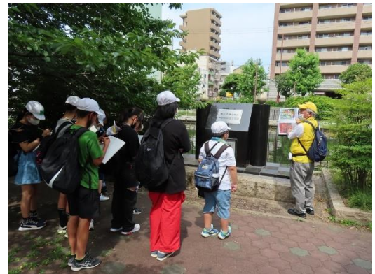
「堺大空襲を偲び平和を祈念する碑」の前で

次に内川沿いの「堺大空襲を偲び平和を祈念する碑」を案内しました。7月10日の空襲は、堺大空襲といわれ「焼夷弾が雨のように落ちてきた」「落ちたところは火の海になった」といわれ、市街地のほとんどが焼け野原になり、たくさんの方が亡くなりました。川には服に付いた火を消そうと飛びこんで火が消えず亡くなった人がいっぱいだったそうです。説明を聞いて戦争は怖いことだと思ったことでしょう。そして平和についても感じるものがあつたのではないのでしょうか。