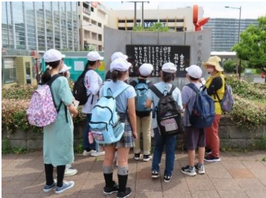
「堺市戦災殉難之地」の前で

小学6年生の戦跡めぐりの堺コースを観ボラが案内しました。大阪城コース、天王寺コースとある中で堺コースを選んだ20名でした。戦跡は他にもありますが、堺市戦災殉難之地、堺空襲を偲び平和を記念する碑、ギャラリーいろはにの防空壕、無縁地蔵尊、神明神社と巡りました。