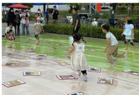
ジャンボ堺かるた大会