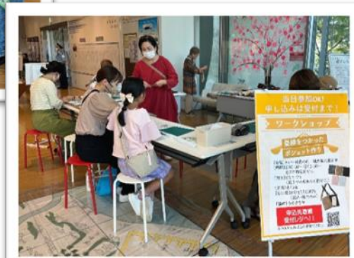
畳縁を使ったポシエット作り