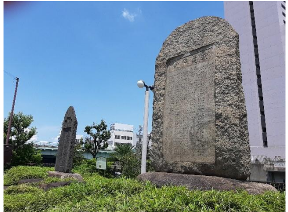
土佐十一烈士の碑

「堺事件を語り継ぐ会」では、事件経過の正しい調査と認識のため、歴史家の皆さんによる講演会を開催したり、事件に関係した土佐藩士のご子孫の皆さんからお話を伺ったり等、堺で発生した事件の情報発信と詳説する活動に務めています。この活動の中には、不定期ながら何度か土佐高知を訪問して、高知で伝承活動をしている人達との交流や意見交換も含まれます。毎年2月に妙國寺で開催されている「フランス水兵も含む烈士達の法要」と高知の関係者の招待を通して理解増進にも務めてきたところです。