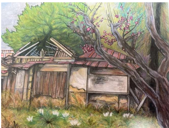
(2011年5月に描いたスケッチ BY kakizawa)

この地の最初の取材は2011年5月、彼らの夢の跡が廃墟として残されていましたが、12年の時を経て2023年8月、再度、訪れたときは、すっかり更地となり数年後には道ができるとか・・・このほど東区のかるたを作成するにあたり、このスケッチを使いたいと東区役所から申し出がありました。文化村跡が消えても、倉橋や文化村の精神が語り継がれていくことを願っています。