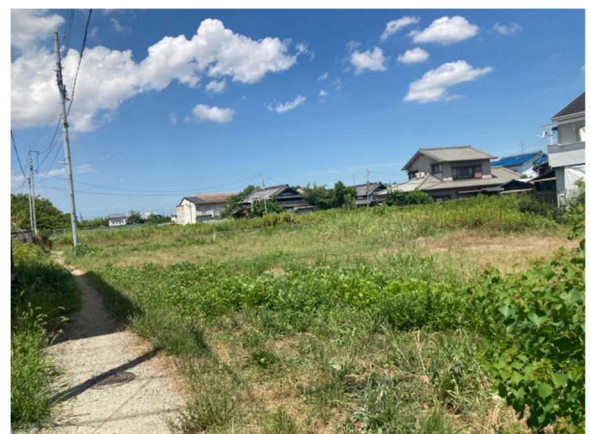
(2023年8月 更地になっていた文化村跡)