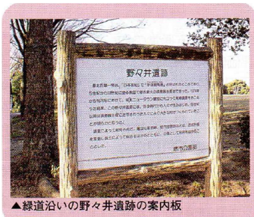
▲緑道沿いの野々井遺跡の案内板

江戸時代からの村名である野々井は、太平寺・小代・大庭寺・三木閉の各村と合併して明治の中頃に北上神村となり、昭和 10 年に鶴田村と合併して福泉町となり、昭和 36 年に堺市へ編入し、菱木村の南に位置する。