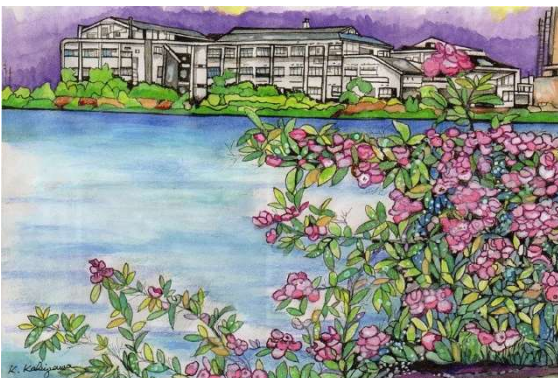
イノバラが咲き乱れる「川池」

浜寺の地名は南北朝時代(14世紀)に臨済宗の僧、三光国師がこの地に大雄寺を建立、吉野の日雄寺を「山寺」と呼ぶのに対し大雄寺を「浜の寺」と呼んだことが由来といわれる。明治の中頃、下石津・船尾・下の三ヶ村が浜寺村となる。昭和17年に堺市の一部となりやがて浜寺石津町、諏訪森町、船尾町、昭和町、元町、浜寺公園のある公園町などに分かれた。浜寺南町はその名の通り浜寺地区の南に位置する。平成6年、生徒数の増加により浜寺中学校から分離