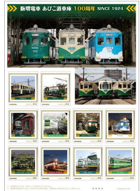
「阪堺電車『あびこ道車庫』100周年SINCE1924」のオリジナルフレーム切手

このように、阪堺電車の路面電車について大いにPRしていただき、堺の観光スポットに今まで以上に多くの観光客に来ていただきたいと願っております。8月27日には「阪堺電車勉強会」が開催されます。