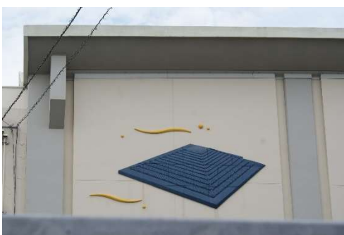
東百舌鳥小学校の土塔の壁画

地区の東端は西高野街道が通る。東区関茶屋との境目には「右高野山女人堂十二里」と刻まれた里程標石が。市立東百舌鳥小学校の体育館には土塔が描かれ、東百舌鳥の誇りを感じさせてくれる。