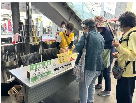
堺市役所1階で呈茶体験や茶筌ふり体験の受付