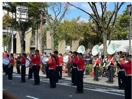
ファミリーストリートでの音楽隊