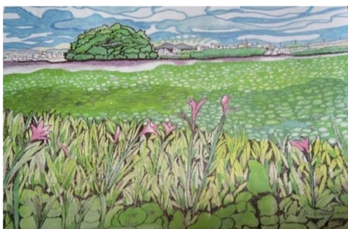
狭山池より流れる北池 遠くに二上山

近年、住宅地が広がってきているが、今も残る河内平野、田園風景に心解きほぐされる。昔は街道筋に商店が並び、賑やかだったと懐かしむ地元の男性たち。