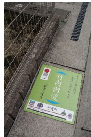
北区野遠町路上にある 「日本遺産 最古の国道 竹内街道」の表示

大阪メトロ新金岡駅から美原区役所行きのバスに揺られて、府道2号（中央環状線）沿いの「野遠」で降りる。道沿いは八下北、その北側が野遠町。二つの町の境目は竹内街道。道路上や電柱などいたる所に「日本遺産 最古の国道 竹内街道」と表示され、古代人が通り抜けた道は1400年以上経た今も人々の往来は絶え間なく続いている。町の東側に西除川が流れ、川の向こうは松原市。