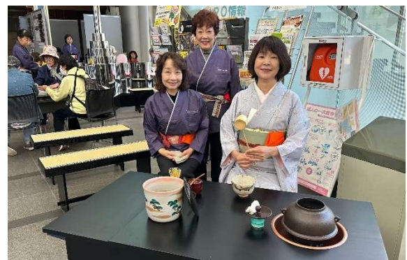
茶々の会が立礼式のお点前を披露