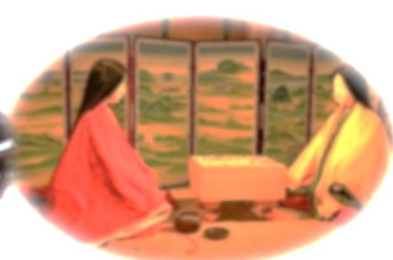
源氏物語ミュージアム