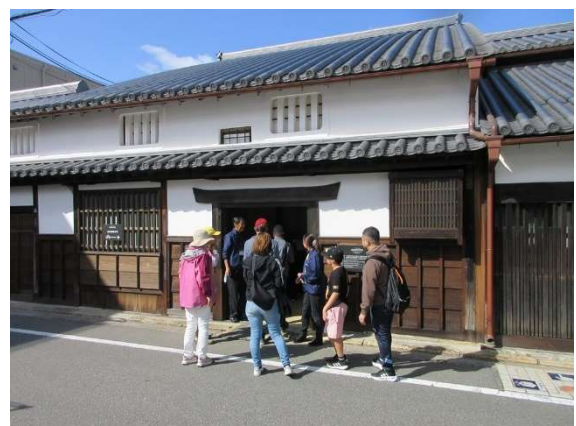
鉄炮ゆかりの地ツアー也大盛況