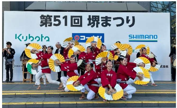
Mina さかいゾーンでの雀踊り