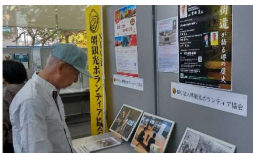
観ボラの宣伝ブース