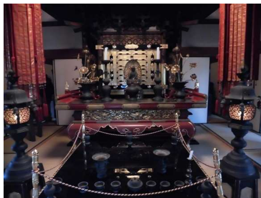
華林寺 ご本尊 薬師如来

このツアーで伝えたかったことは、仏教を天皇や皇族、貴族達が独占し、一般民衆への布教すら許されない時代に、行基は、民衆とともに暮らし、民衆を救う活動を、弾圧を受