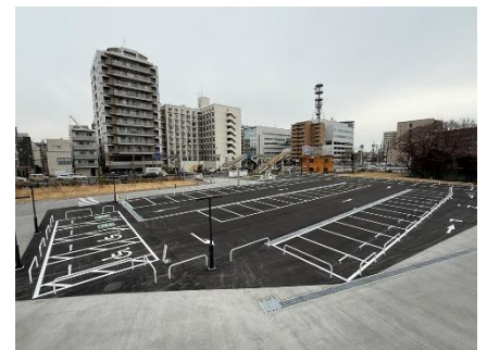
棧橋に直結の駐車場