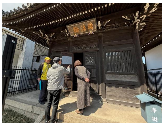
本願寺経堂 転法輪