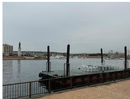
旧堺港に設置された臨時の棧橋