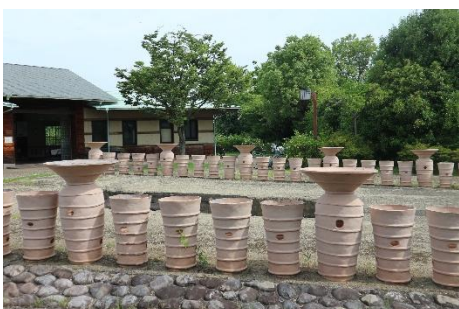
黒姫山古墳ガイダンス施設

黒姫山古墳は、区内に現存する唯一の古墳で、5世紀中頃に軍事や外交などに携わった丹比氏の首長の墓とされています。戦後の発掘調査で