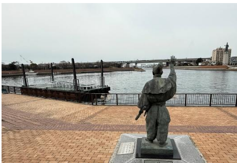
旧堺港に設置された臨時の棧橋

大和川リバーサイドサイクルラインでコスモスクエア駅、駅から万博会場へは電車で1駅 金額330円(片道)、所要時間60分(堺市役所~万博会場)・予約は不要です。