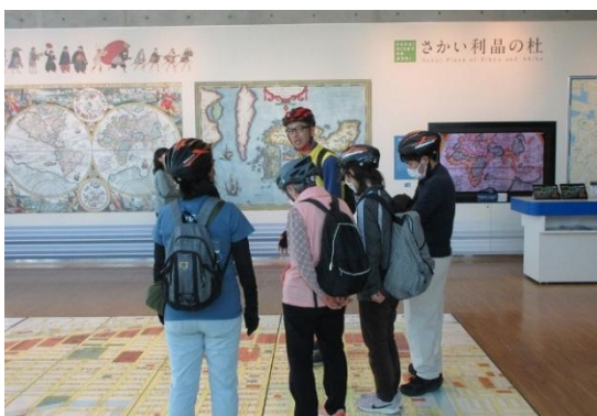
④堺環濠都市を自転車で巡る