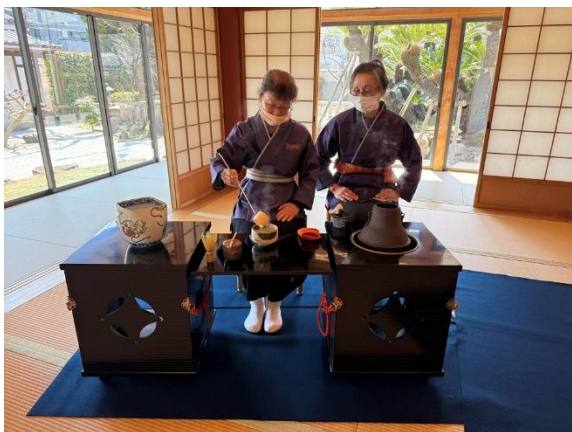
妙國寺 茶々の会の立礼