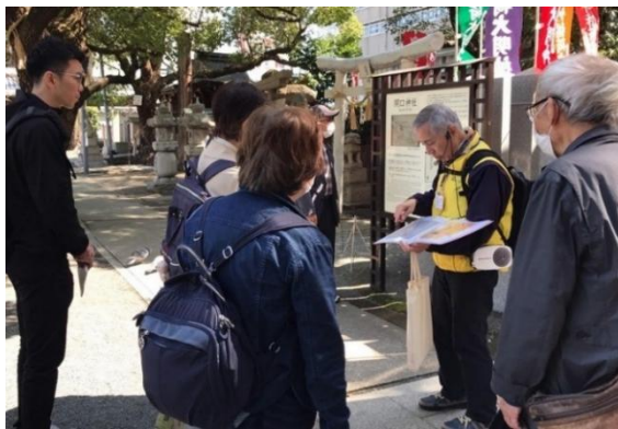
①堺に生まれた利休の謎を巡る