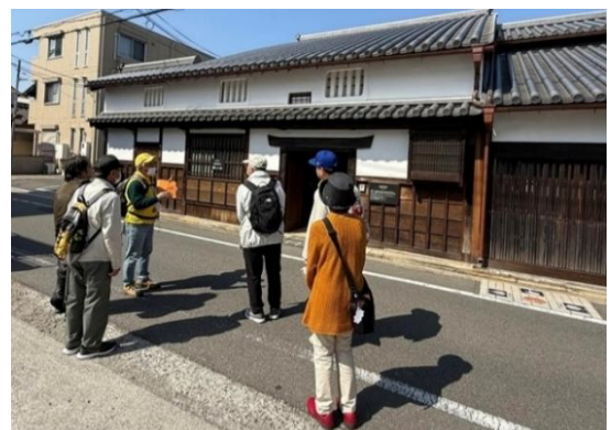
②堺環濠都市の謎を巡る