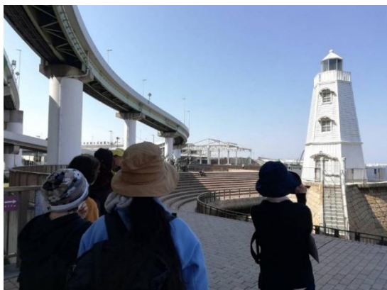
③近代の堺旧港の史跡を巡る