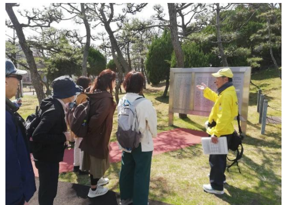
③近代の堺旧港の史跡を巡る