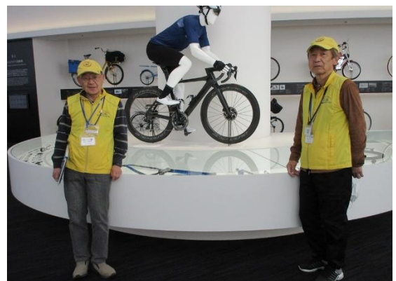
④堺環濠都市を自転車で巡る