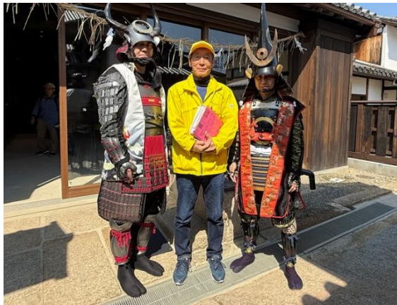
②堺環濠都市の謎を巡る