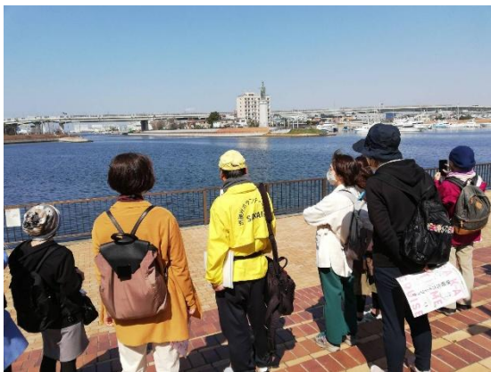
③近代の堺旧港の史跡を巡る