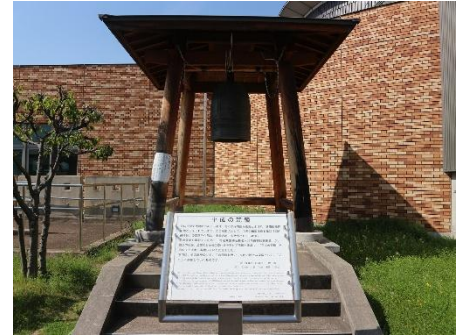
堺市立みはら歴史博物館・梵鐘

れるほどの賑わいを見せました。鑄物師とは、生活道具や梵鐘・仏像などを鑄造した技術者のこと、河内鑄物師は多彩な作品によってその高い技術が実証されています。