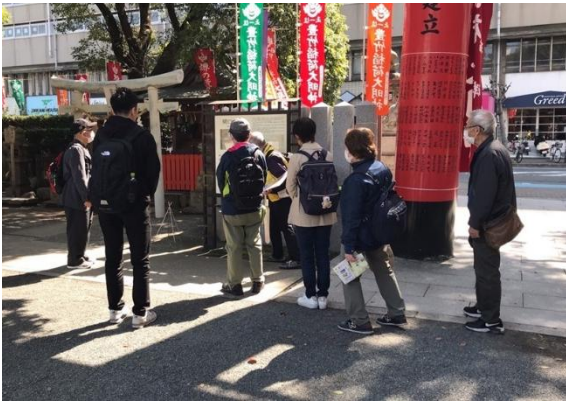
①堺に生まれた利休の謎を巡る