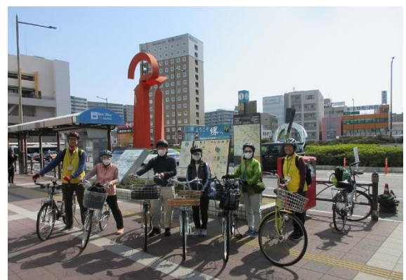
④堺環濠都市を自転車で巡る