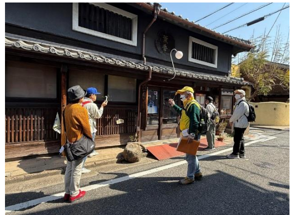
②堺環濠都市の謎を巡る