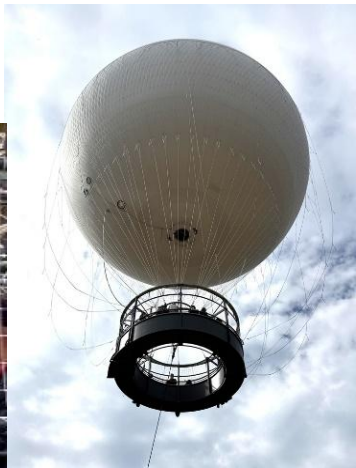
【やっと気球に乗れた！】