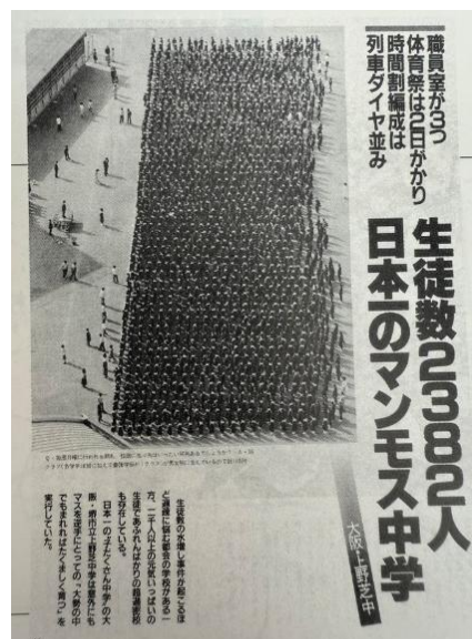
毎日新聞社刊「毎日グラフ」 1985(昭和 60)年 5 月 26 日より

現在上野芝中学は生徒数が減り、390 名 15 学級となっていますが、当時の広大な敷地は、広々としたグラウンドや中庭、大規模な体育館の広さにつながっており、現在も優れた部活動環境が整っているとされています。